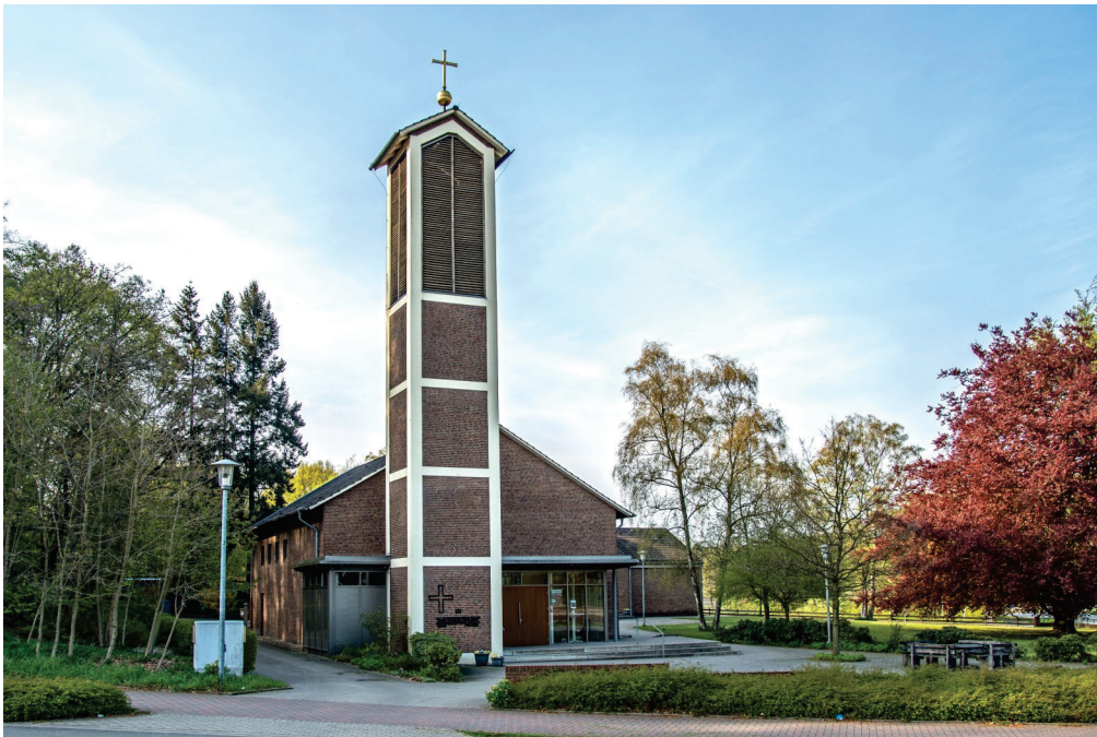
Ev.-luth. Kirche „Zum Guten Hirten“ Schützenstraße 4, Damme